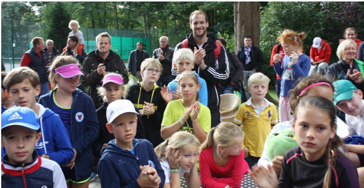
Bei der Siegerehrung schauten natürlich viele Teilnehmer und Teilnehmerinnen zu.